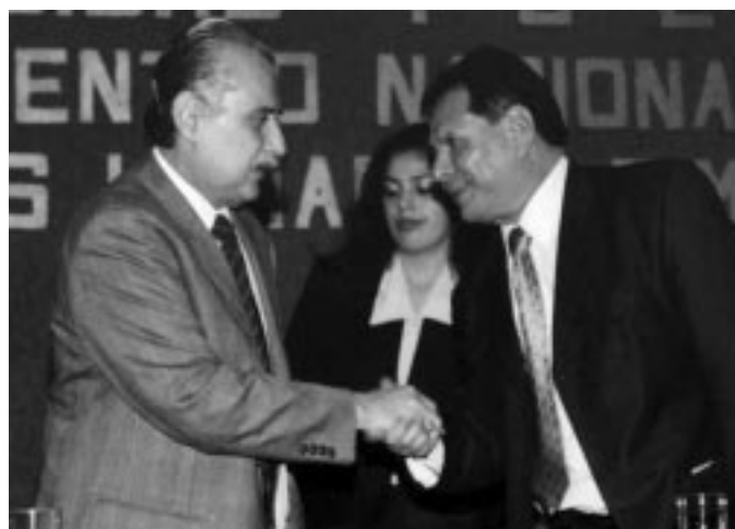
Saludo de rectores, el Coordinador de la Comisión y el Anfitrión