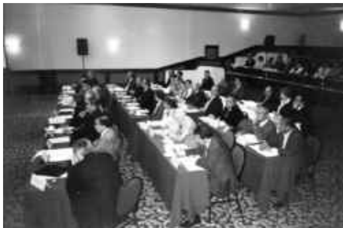
Un aspecto del salón durante la sesión de trabajo del jueves 29 de abril

de los organismos de los sectores productivo y social, de nuestros pares académicos y universitarios nacionales y del extranjero y de la sociedad mexicana en general.