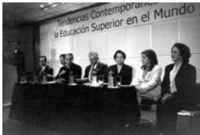
Inauguración de la Asamblea en la U. de Monterrey

fortalecer los mecanismos que nos permitan, por un lado, evitar la proliferación de instituciones que no cumplen con los requisitos establecidos para poder ofertar, para poder impartir educación superior de buena calidad; eso nos ha llevado a fortalecer nuestros mecanismos de supervisión; también a buscar las condiciones para que en colaboración con los gobiernos de los estados apliquemos de manera conjunta los lineamientos del Acuerdo 279”.