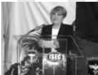
La periodista Lolita Ayala, en la fiesta de aniversario de ISEC