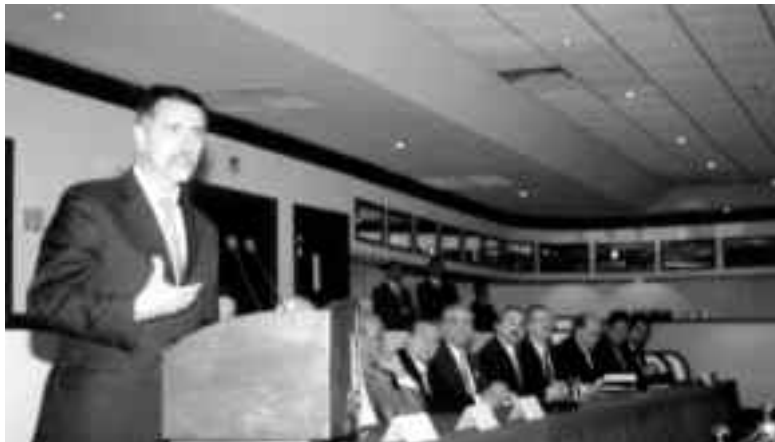
Lic. Carlos Abascal, Secretario de Trabajo y Previsión Social, dirigiéndose a los rectores de FIMPES

En el marco de la firma del Convenio General de Colaboración y Concertación Académica entre la Secretaría del Trabajo y Previsión Social (STPS) y la Federación de Instituciones Mexicanas Particulares de Educación Superior (FIMPES), el pasado 29 de abril en Monterrey, Nuevo León, el titular del ramo, Carlos Abascal Carranza, dijo respecto a los egresados de las universidades, que el compromiso de la STPS, entre otras actividades, es ampliar sus bolsas de trabajo y laborar intensamente en la reorientación vocacional profesional de los estudiantes que ya terminaron sus estudios y no encuentran espacios laborales.