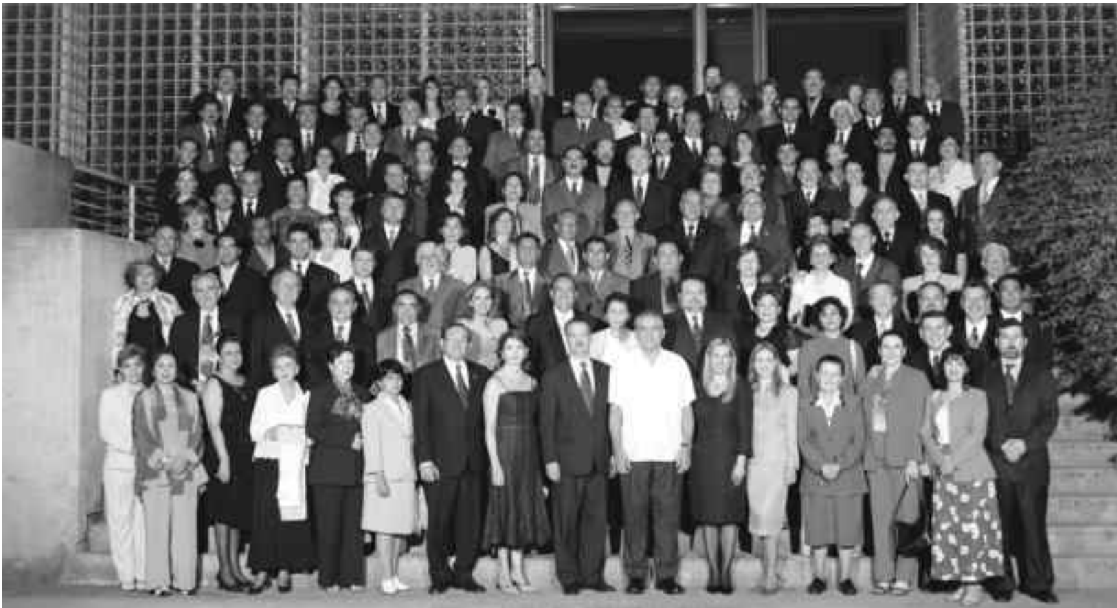
Fotografía oficial de la XLV Asamblea en la Universidad de Monterrey