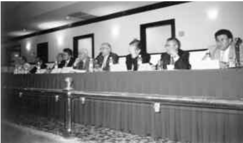
El presidium durante las sesiones del jueves 29