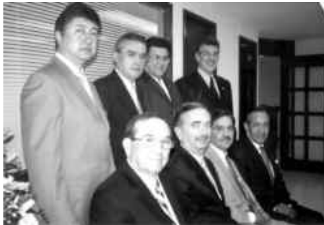
El nuevo Consejo Directivo en las oficinas de la FIMPES