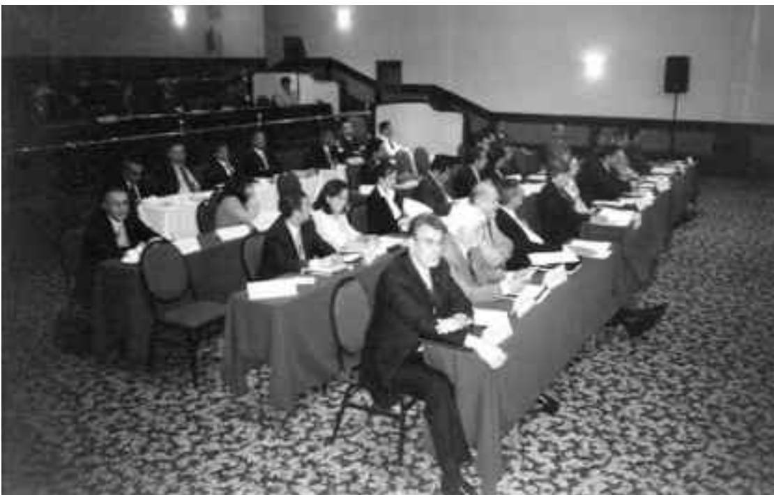
Asambleístas durante la sesión del viernes 30

sistema, por el reconocimiento de su buena calidad, y que evidentemente nos han permitido avanzar en el cumplimiento de las metas del Programa Nacional de Educación. Este espacio de colaboración entre FIMPES y la SEP debe continuar fortaleciéndose como ha sido el propósito de todos nosotros a lo largo de estos tres años, que nos permita seguir construyendo acuerdos para poder transitar en temas de interés común sobre todo hoy que tenemos evidentemente desafíos, demandas de una sociedad; y que por otro lado el poder legislativo ha tomado cartas en el asunto y ha mostrado mayor interés en buscar los mecanismos que nos permitan contar con esquemas más fortalecidos para el desarrollo del sistema de educación superior”.