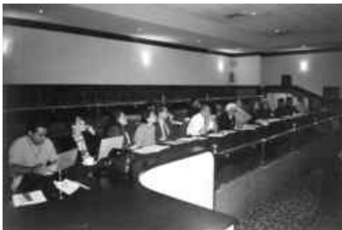
Grupo de observadores e invitados durante la Asamblea

“ En esta ocasión y a 13 meses y 9 días de haber asumido el cargo con el que ustedes tuvieron a bien distinguirme, más que presentarles una relatoría de lo hecho por el Consejo Directivo y los demás órganos que componen a la FIMPES, procederé a formular algunas ideas y reflexiones de lo que me ha dejado de experiencia esta presidencia y mi calidad de fundador y de consejero en 19 de los casi 23 años de vida que tiene la Federación.