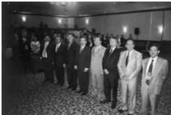
El Consejo Directivo 2004 - 2005