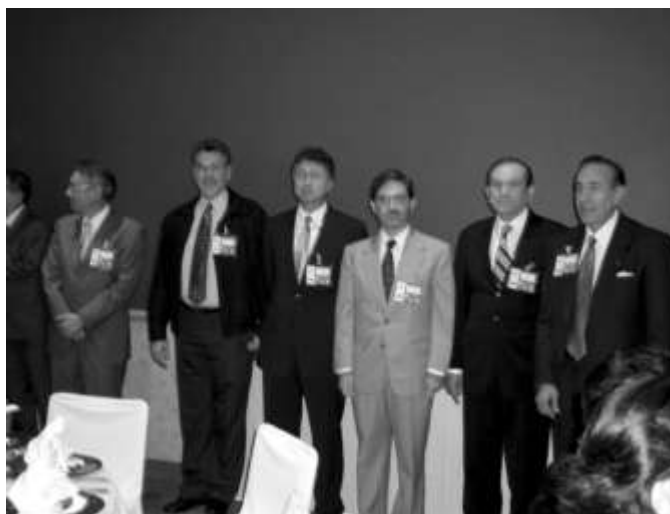
Entrega del premio FIMPES por el Consejo Directivo