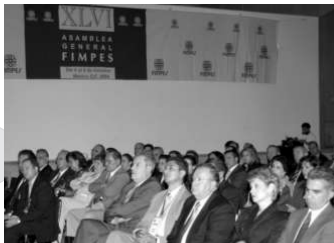
Participantes en la inauguración de la Asamblea