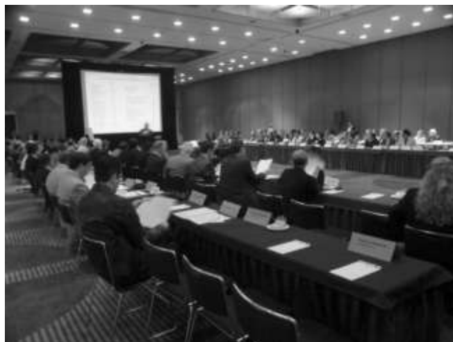
Asambleístas en la sesión de trabajo del jueves 7

La idea es propiciar un grupo que auxilie a las instituciones interesadas en armar estrategias de supervivencia y superación a base de alianzas que les permitan internacionalizarse y generar sinergias (contratación de maestros, proyectos de investigación, etcétera).