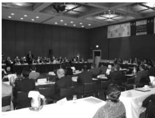
Aspecto de la XLVI Asamblea