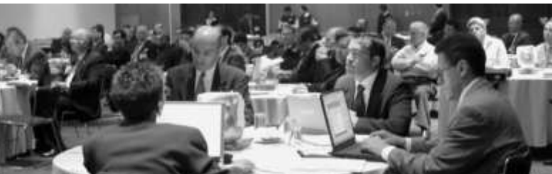
Asambleístas en la reunión de trabajo

bases que han constituido a la FIMPES, es esencial que esta Federación pueda exponer y defender una y otra vez el significado y el valor de la libertad”, con el objetivo de generar una resonancia adecuada en los Congresos federal y estatales.