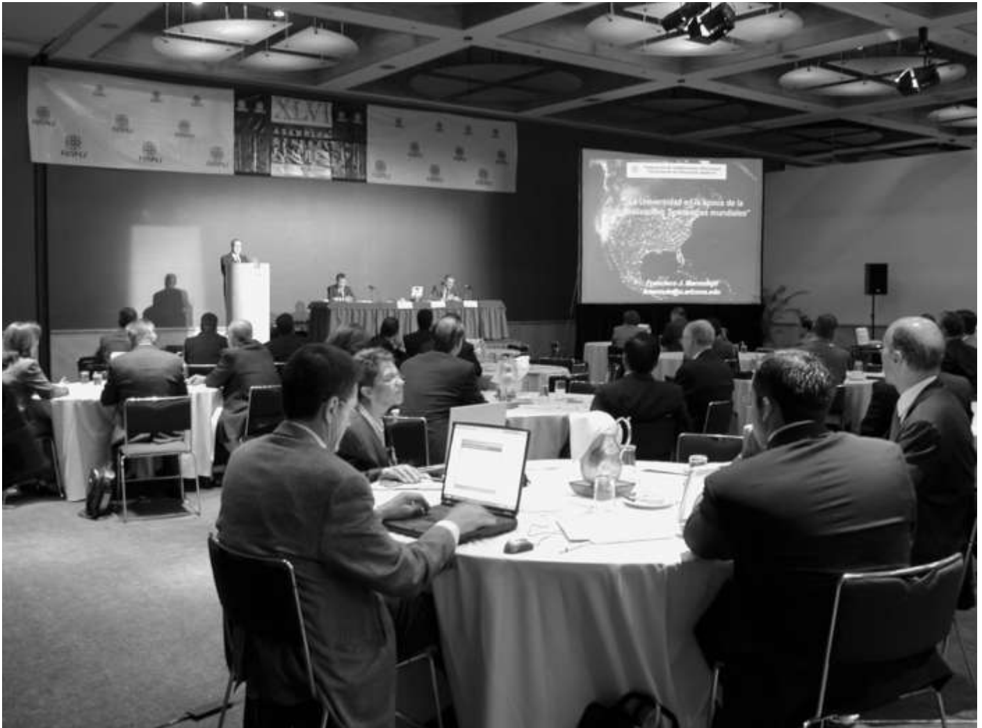
Participantes de la Asamblea durante los paneles