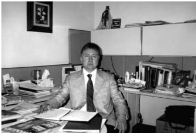
Mtro. Francisco Lejarza Gallegos, Presidente de FIMPES.

En este sentido, ¿cuáles serían sus propuestas a corto plazo, para solventar los actuales requerimientos de FIMPES?