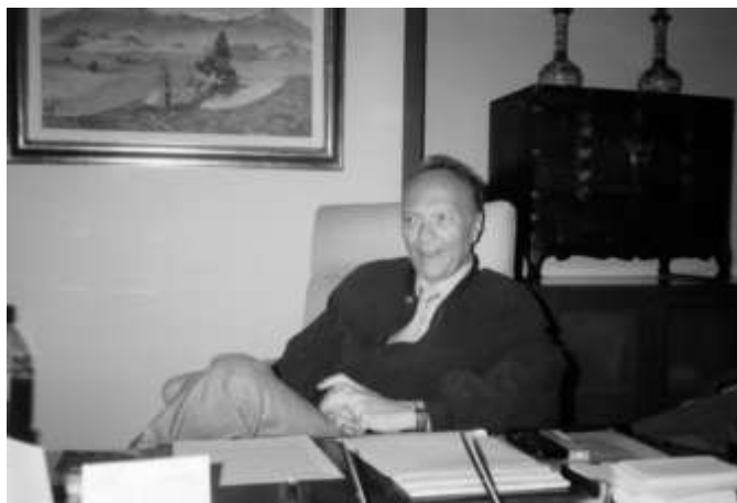
Dr. Alejandro Gertz Manero, Rector de la Universidad de las Américas

Por ello podemos decir que los procedimientos de acreditación de FIMPES no difieren prácticamente en nada de las instituciones norteamericanas, más que en los aspectos locales . Eso nos da la garantía de que estamos bajo un sistema de funcionalidad demostrada; inclusive, en esta administración estamos proponiendo la realización de un convenio con las estructuras de acreditación norteamericanas, para que reconozcan la calidad internacional que tienen nuestros procedimientos”.