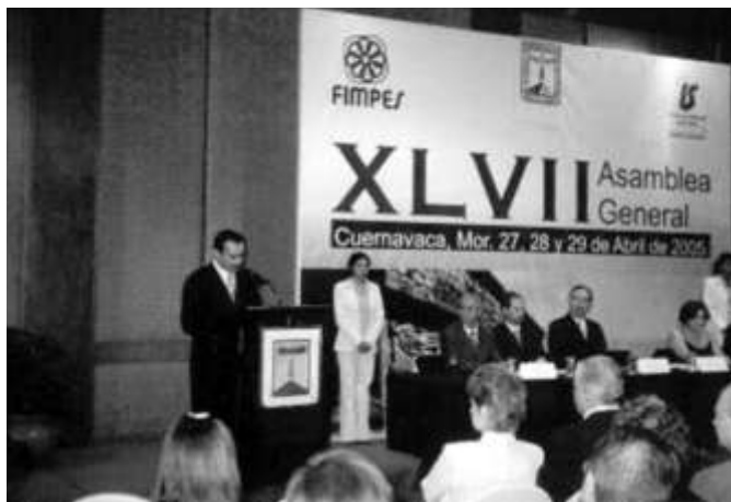
Lic. Sergio Estrada Cagigal, Gobernador Constitucional del Estado de Morelos.

De igual manera, exhortó a los miembros integrantes de FIMPES a cerrar filas en contra de las instituciones educativas “piratas”, a las que calificó como “los ambulantes de la educación”, y a quienes responsabilizó de la perversión y el abaratamiento de la enseñanza superior, al dar prioridad a intereses de tipo económico, con el mínimo esfuerzo y en poco tiempo, en detrimento de una formación académica de calidad.