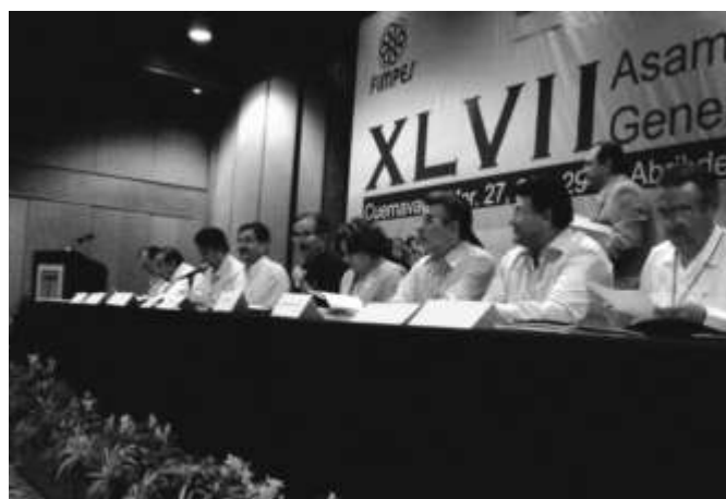
Consejo Directivo durante la XLVII Asamblea General Ordinaria.